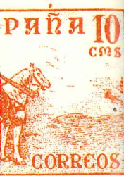
procedente de todo tenía que ser pura del Cid.

ede obtener eine, línea y áquina perfora nzar perfora el de la segunda hasta do sólo o vertical u e girar noventa gunda a la primera. ecos vacíos tas. El tercero pleta de una pasada, maño de sellos de la struir un molde normal en las eron estudiados and, inventor e un aparato mero de entado queda o de dientes dentado ero de dientes horizontal. cifra, «dentado ro de dientes es s.