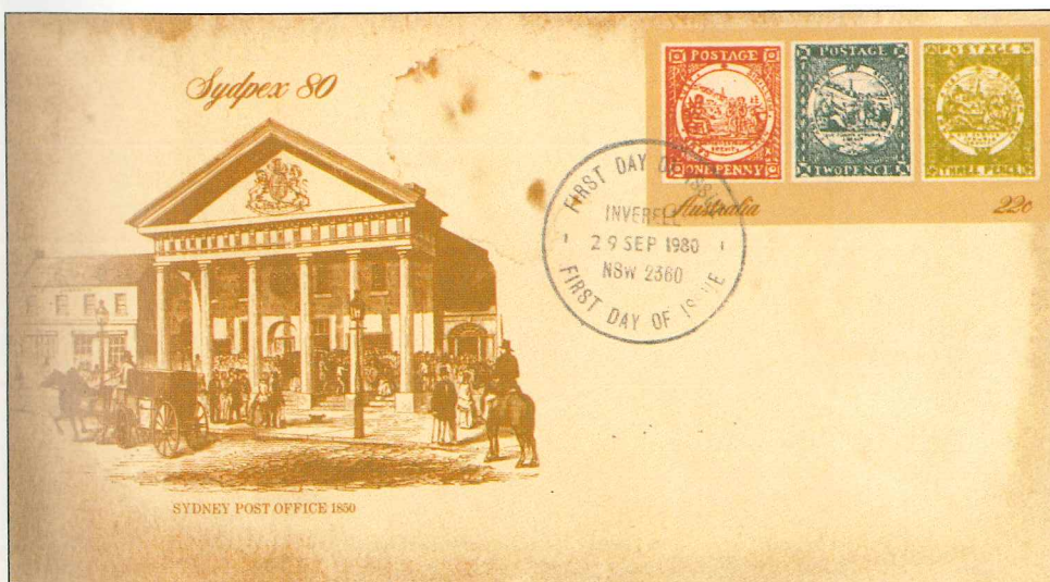
Al lado, sobre entero postal de Australia emitido en 1980 en el curso de la Semana Nacional del Sello. Es un sobre de primer día «envejecido» a imitación de un sobre antiguo; su motivo principal es la oficina de correos de Sydney en 1850.