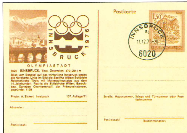
Arriba, entero postal de Austria. Perteneció a la serie que anunció los XII Juegos Olímpicos de Invierno, celebrados en Innsbruck en 1976.