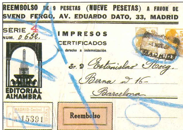
Entero postal de iniciativa privada emitido en 1931 con dos sellos impresos de la Matrona.